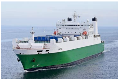
Baltica outside Travemünde